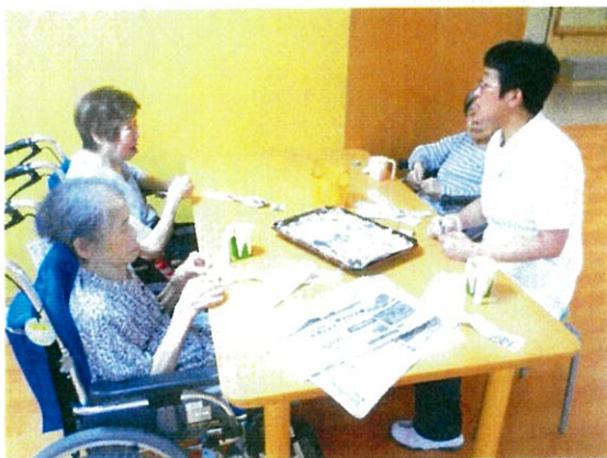
お盆の製作中（みんなで会話しながら）

リハビリではセラピストがテーブルごと周り、ゴムバンドで腕の筋力訓練や胸郭を広げるような動きを取り入れた運動をしています。また、スタッフがついてゴミ箱を折ったり（これは工程ごと役割分担をして取り組んでいます。）、最近では新聞紙を利用したお盆作りなど、作業を取り入れた訓練も行っています。みんなで力を合わせて1つの事を行うと出来上がった時の喜びも倍増しますね。