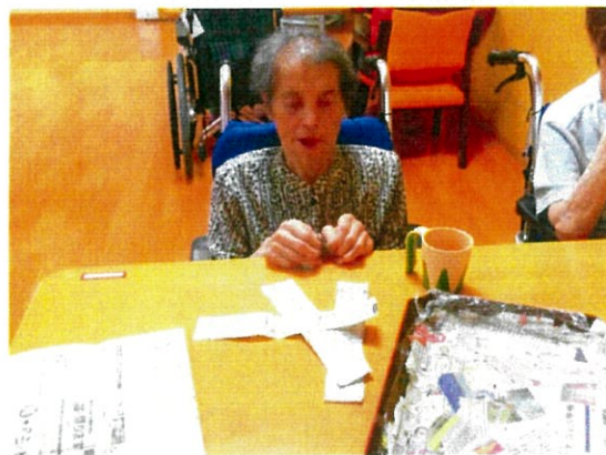
お盆の製作中（新聞をちぎる）

私たちが興味や関心を持つことが異なるように、利用者さまも興味を持っていること、好きなこと、得意なことが違います。