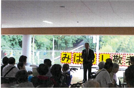
『荒堀管理者よりあいさつ』