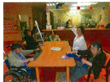
セラバンドを使ってみんなで体操中

何事も継続して行い、メリハリをつけて生活を送れるよう、体を動かすことや考えることを習慣にできるといいですね。