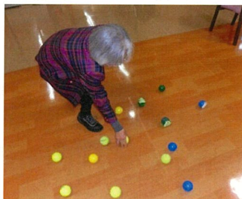
拾っているのは みかん？じゃがいも？それとも…

そんな生活の動作の他にも“こんな事、あんな事、楽しみたい!”という、生活を豊かにするためのお手伝いも出来たら嬉しく思います。ぜひ、声をかけてください。