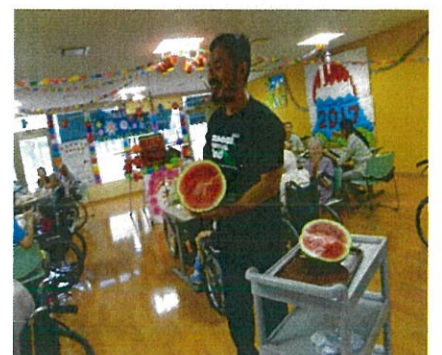
3階フロア納涼祭でのスイカお披露目