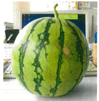
スイカの成長の様子