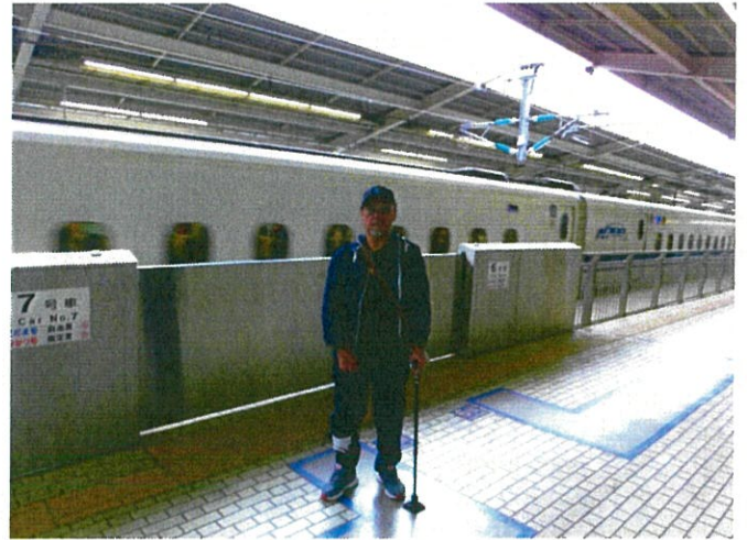
熱海の新幹線ホームまで来ました。 お疲れ様でした。