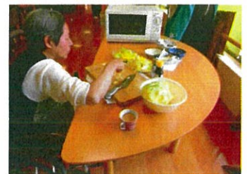
レシピを紹介して下さり ありがとうございました。