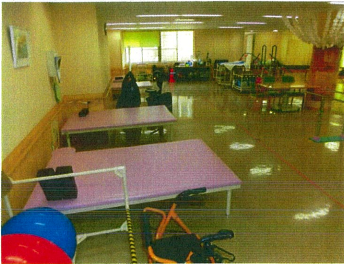
リハビリ機能訓練室の様子です