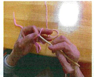
シュッと引き抜きます