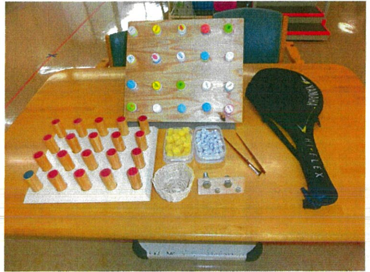
手や腕のリハビリに使う道具の一部です